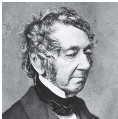
Forfatteren Carsten Hauch (1790-1872) og hans drama; 'Don Juan', udkom i 1829.

Professor Hauch, var en af de enkelte, som talte meget ondt om min bog, ja, frakendte mig talent, jeg havde ikke den agtelse for ham, som for Oehlenschläger, blev derfor vred, og da