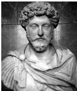
Den romerske kejser Marcus Aurelius Antoninus (121-180). Det er i hans bog: Den romerske Kejsers opbyggelige Betragtninger over sig selv forfattede udi tolv Bøger (1752), at Sokrates omtales.

Modsætningen danner spekulationen, der vil gøre den afsjælede historiske individualitet til en